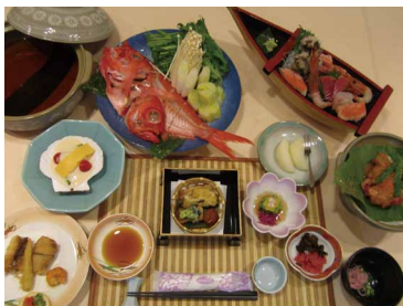
大皿 船盛りは、各2人前