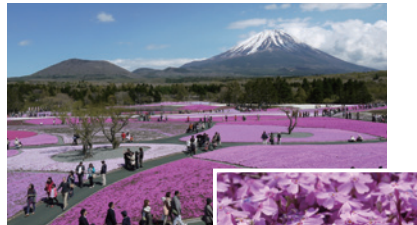
富士山麓を彩る芝桜

仙石ロッヂ支配人より「富士芝桜まつり」を紹介します。首都圏最大級の80万株！行かれたことのない方は、ぜひ足を運んでみてください。富士山と色鮮やかな芝桜のコントラスト、記念写真や家族の思い出アルバムにカメラ持参でいかがでしょうか？青い空とピンクの芝桜、まだ白い雪帽子を被った富士山、きっと心に刻まれる景色に巡りあえると思います。期間中は混雑しますが、箱根の仙石ロッヂ宿泊なら大丈夫！ゆっくり楽しんで、疲れたからだを源泉掛け流しの温泉で癒し、休日をリフレッシュしてください。スタッフ一同、お待ちしております。