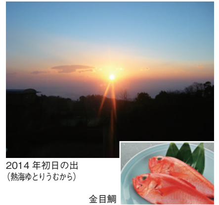
2014年初日の出 (熱海ゆとりうむから)

通常の夕食献立のうち鍋物、煮物、お造りを金目鯛特別料理に代えてお召し上がりいただけます。プリプリの食感のお刺身や、お箸でほろりとくずれる兜煮。調理法に